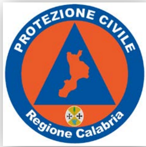
ASS. PROT. CIVILE VOLONTARIATO 27 MHZ