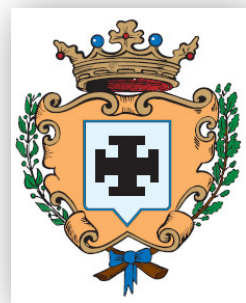
PROVINCIA DI COSENZA