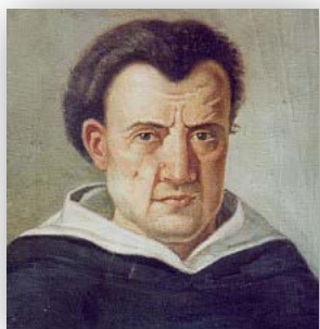
I M S "T. CAMPANELLA" BELVEDERE M.mo